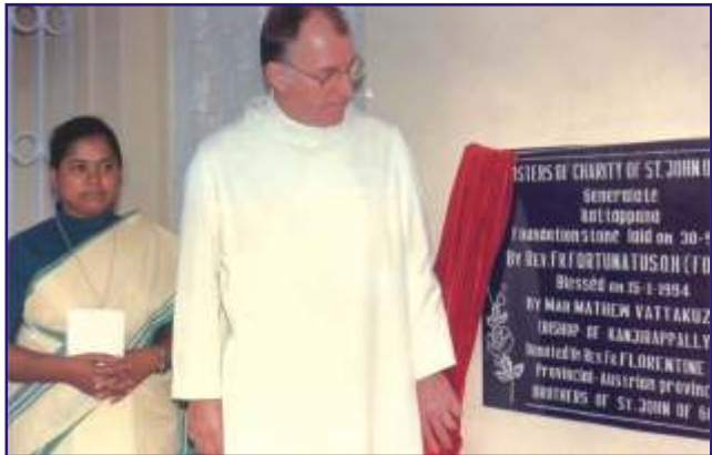
Generalate Blessing (1994)