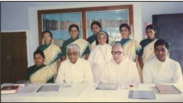
First Election (1992)

വേദനിക്കുന്ന സഹോദരങ്ങൾക്ക് അമ്മയും സ്നേഹി