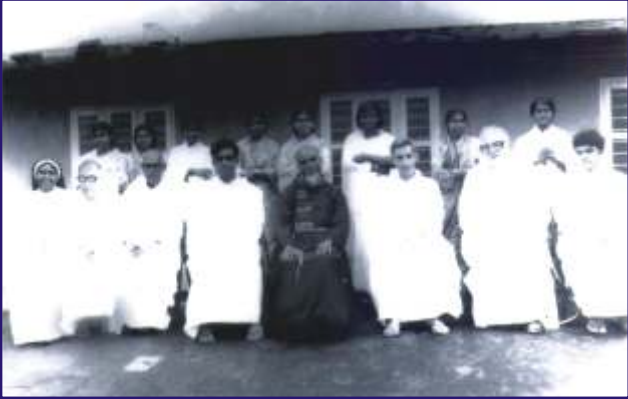
First Members (1977)

സതീർത്ഥകരുടെയും മാതാപിതാക്കളുടെയും ഗുരു നാഥൻമാരുടെയും അനുഗ്രഹശ്ലീസുകളോടെ സ്നേഹത്തിന്റെ, സേവനത്തിന്റെ, പക്വതയുടെ പ്രതീകമായി ഇന്ന് ജനമദ്ധ്യത്തിൽ മുന്നേറുകയാണ് സിസ്റ്റേഴ്സ് ഓഫ് ചാരിറ്റി ഓഫ് സെന്റ് ജോൺ