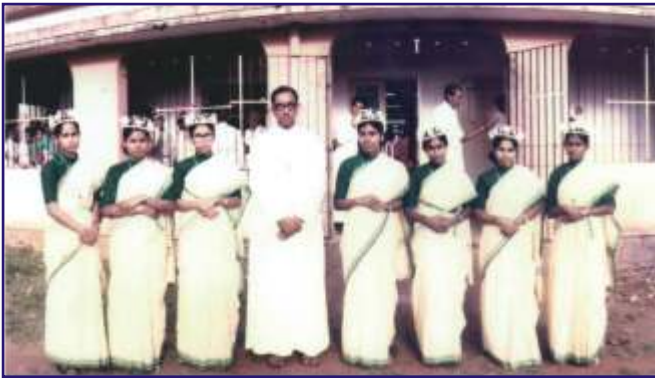
First Profession (1984)

എന്ന മഹാനായ മനുഷ്യസ്നേഹി. ക്രിയാത്മകതയും ആത്മവിശ്വാസവും അചഞ്ചലതയും കൈമുതലാക്കിയ ഒരു