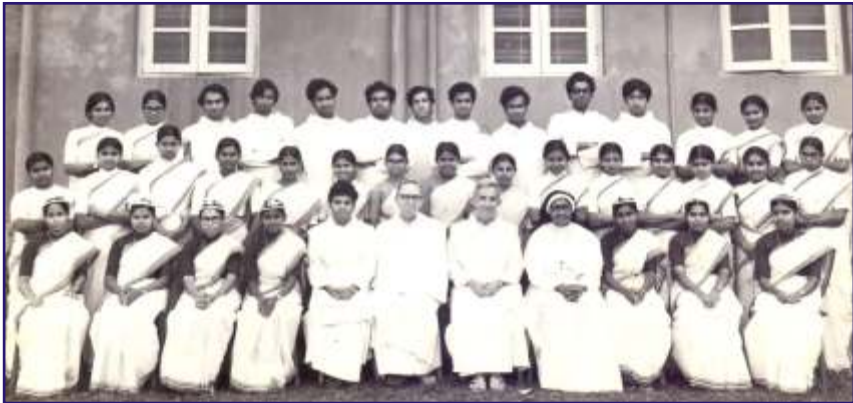
First Profession (1984)

ഓഫ് ഗോഡ്. എത്ര സ്നേഹമുണ്ടെങ്കിലും പെറ്റമ്മപോലും പരാജയപ്പെടുന്ന നിസ്സഹായതയ്ക്കരികിൽ ജീവിതം സമർപ്പിച്ച് അനേകം മക്കൾക്ക് ത്യാഗസ്വർഗ്ഗങ്ങൾ നൽകി കടന്നുപോവുകയാണ് കഴിഞ്ഞ 37 വർഷത്തിലൂടെ എസ്.സി.ജെ.ജി. സമൂഹം. വ്യത്യസ്തമായ ജീവിത അനുഭവത്തിലൂടെ കൈപിടിച്ച് നടത്തിയ നല്ല തമ്പുരാൻ നന്ദി പറയുന്ന തോടൊപ്പം ആതുരസേവനം പ്രധാന ദൗത്യമായി സ്വീകരിച്ചിരിക്കുന്ന സെന്റ് ജോൺ ഓഫ് ഗോഡ് സന്യാസിനി സമൂഹം കാലത്തിന്റെ ചുവരുകളെ ഭയപ്പെടാതെ വിവേചിച്ചറിഞ്ഞ് അനുസ്യൂതം മുന്നേറിക്കൊണ്ടിരിക്കുന്നു. ദൈവവും മനുഷ്യനും തമ്മിലുള്ള ബന്ധത്തെ നിർണ്ണയിക്കുന്ന സ്നേഹമെന്ന സിദ്ധാന്തത്തിന് സേവനത്തിന്റെ മുഖം നൽകിയ മഹാനായ മനുഷ്യസ്നേഹിയാണ് സെന്റ് ജോൺ ഓഫ് ഗോഡ്. അയൽക്കാരന്റെ സഹനത്തിലും ഇല്ലായ്മയിലും ഹൃദയം വേദനിക്കുകയും, ജാതിമതഭേദമന്യേ എല്ലാ ആത്മാക്കളുടെയും നിത്യരക്ഷയിൽ അതിവ ശുഷ്കാന്തി പുലർത്തുകയും ചെയ്ത ഈ പുണ്യ പിതാവാണ് എസ്.സി.ജെ.ജി. യുടെ സ്വർഗ്ഗീയ മദ്ധ്യസ്ഥൻ. “എന്റെ ഏറ്റവും എളിയ ഈ സഹോദരനായ ഒരു വനിതയുടെ ഇത് ചെയ്തു കൊടുക്കുമ്പോൾ എനിക്കു തന്നെയാണ്