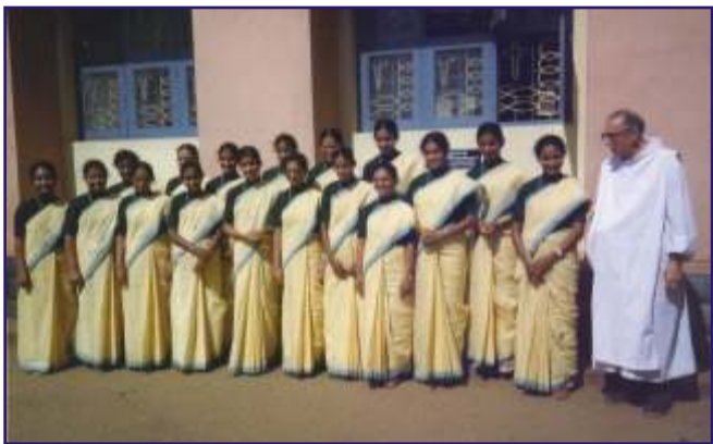
Final Profession (1992)

ചരിത്രവഴികളിലൂടെ കടന്നുപോകുമ്പോൾ പിൻതിരി